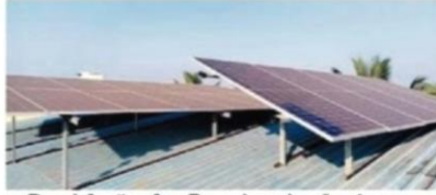
गडहिंगलज येथील डॉ. घाळी महाविद्यालयाने उभारलेला सौरऊर्जा प्रकल्प. दुसऱ्या छायाचित्रात घाळी महाविद्यालय.

लोकमत न्यूज नेटवर्क गडहिंगलज : येथील डॉ. घाळी कॉलेज ऊर्जेच्या बाबतीत स्वयंपूर्ण बनले आहे. ९ लाख रुपये खर्चून उभारण्यात आलेल्या सौरऊर्जा प्रकल्पामुळे दरवर्षी अडीच लाख रुपयांच्या वीज बिलाची बचत होणार आहे. त्यामुळे शिवाजी विद्यापीठ कार्यक्षेत्रातील 'ऊर्जा निर्भर' झालेले हे पहिलेच महाविद्यालय आहे.